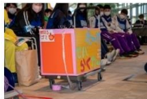
運搬に特化したアイテム例